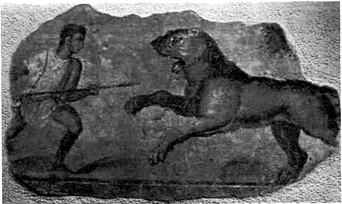
Gladiador enfrontant-se a un lleó. Fresc de l'amfiteatre romà de Mèrida.