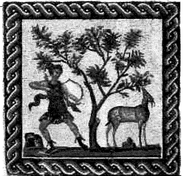
Diana caçadora, segle III. Museu del Bardo, Tunis.

Tres deae solae innubae sunt 13 : Minerva, Diana et Vesta.