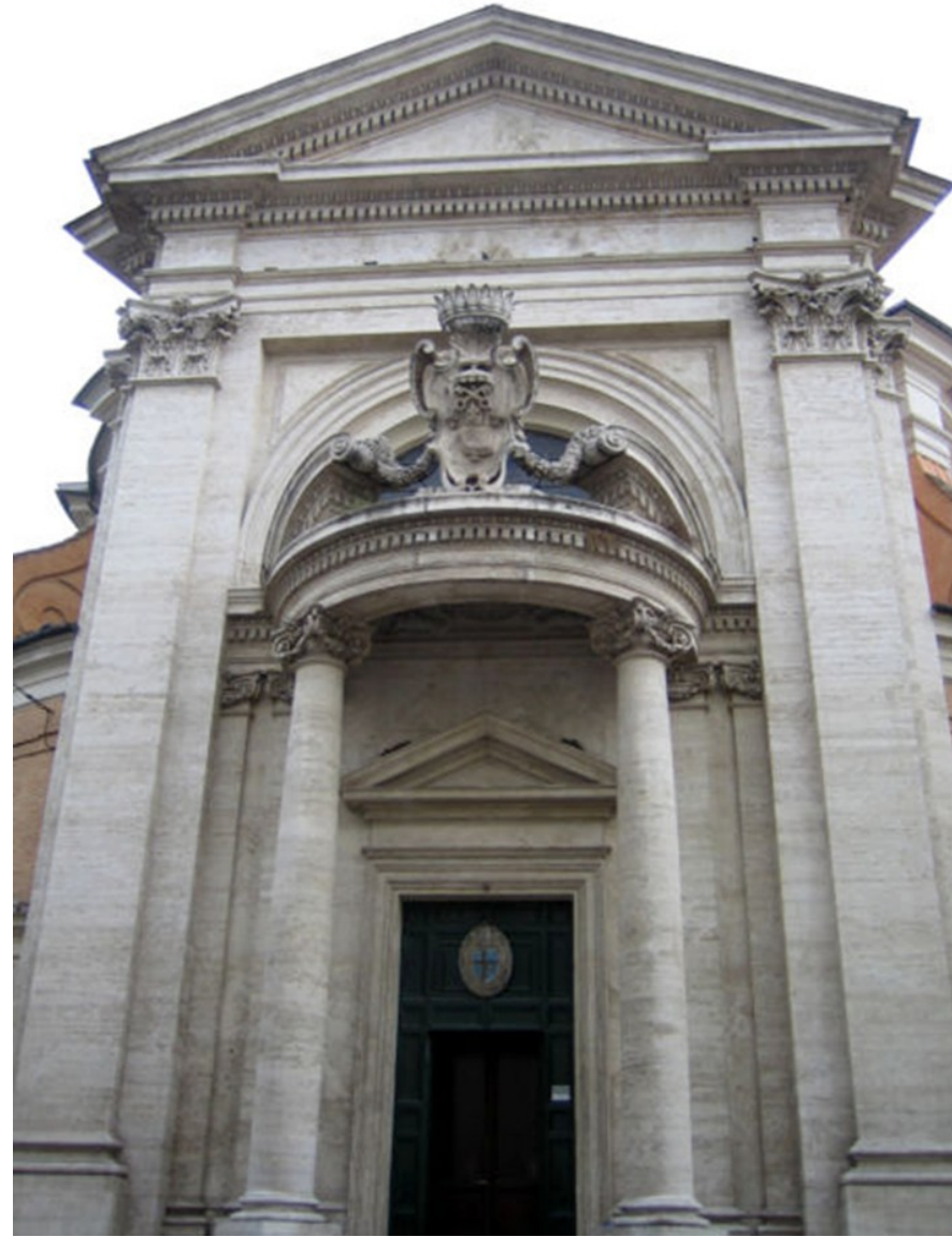
Bernini, San Andrea del Quirinale, Roma

-La planta també esdevé més dinàmica amb la superació de la planta longitudinal i la creació d'espais més complexos.