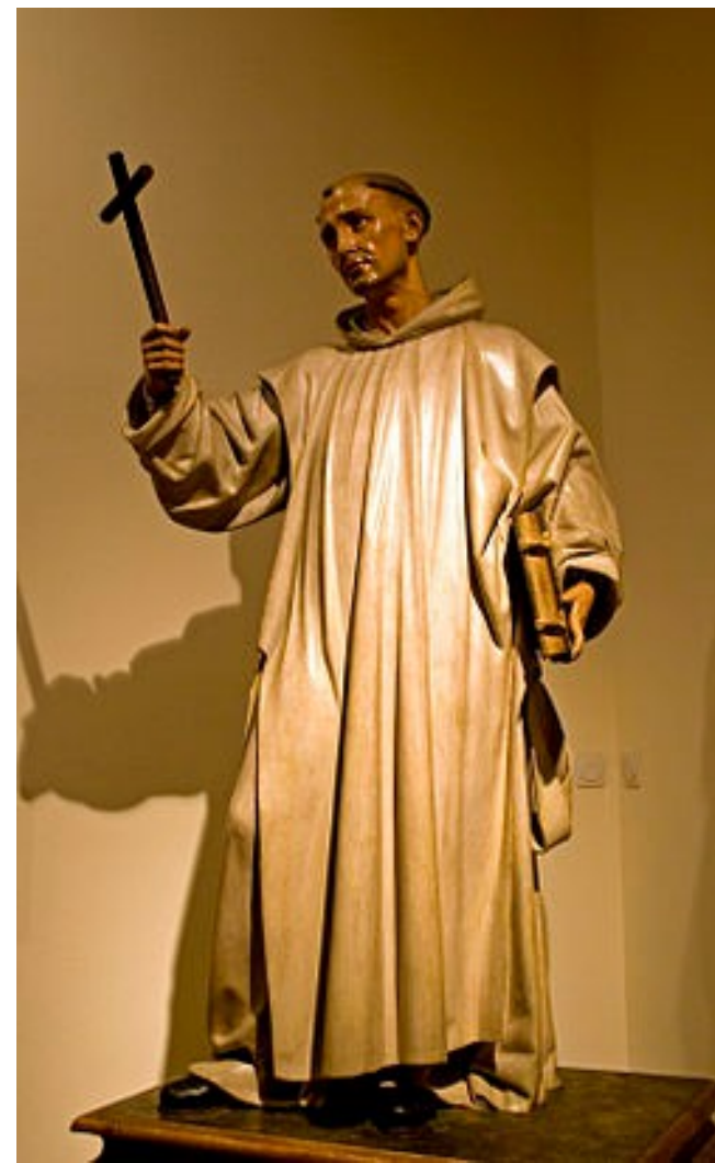
Martínez Montañés St. Domingo penitente, El Nen Jesús i St. Bruno