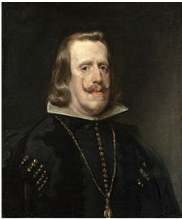
Velázquez, Felip IV

La monarquia hispànica començà una etapa de decadència política i econòmica, tot i que en les lletres i les arts el segle XVII es coneix com el segle d'or . A Amèrica seguiria dominant gran part del continent, juntament amb Portugal. A Europa encara mantindria Flandes, Nàpols i la Llombardia.