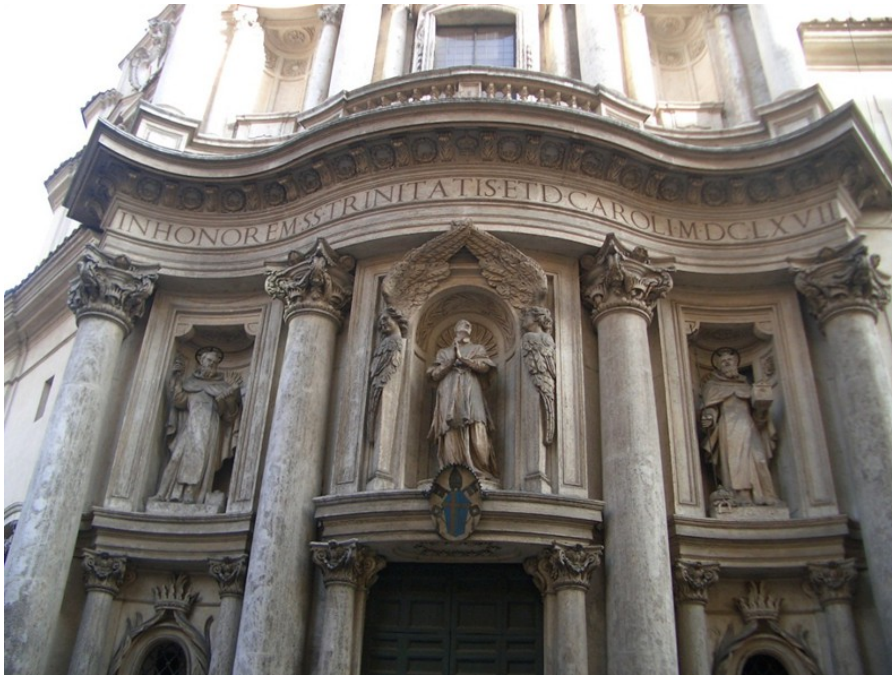
Borromini, façana ondulada de San Carlo alle Quattro Fontane