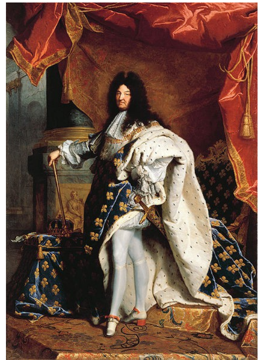
Rigaud, El Rei Sol, 1701

A Anglaterra es restaurà la tradició parlamentària després de la insurrecció de Cromwell i l'execució del rei Carles I. És posaran les bases de l'expansió científica posterior amb Newton. Serà, juntament amb Holanda, l'únic país amb una monarquia parlamentària.