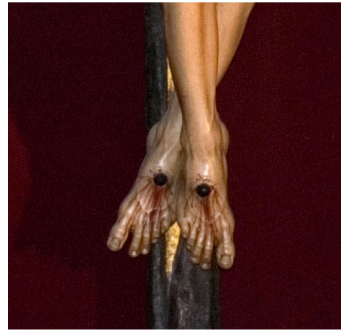
Juan Martínez Montañés, El Cristo de la Clemencia o de los Cálizes , escultor de l'escuela sevillana.