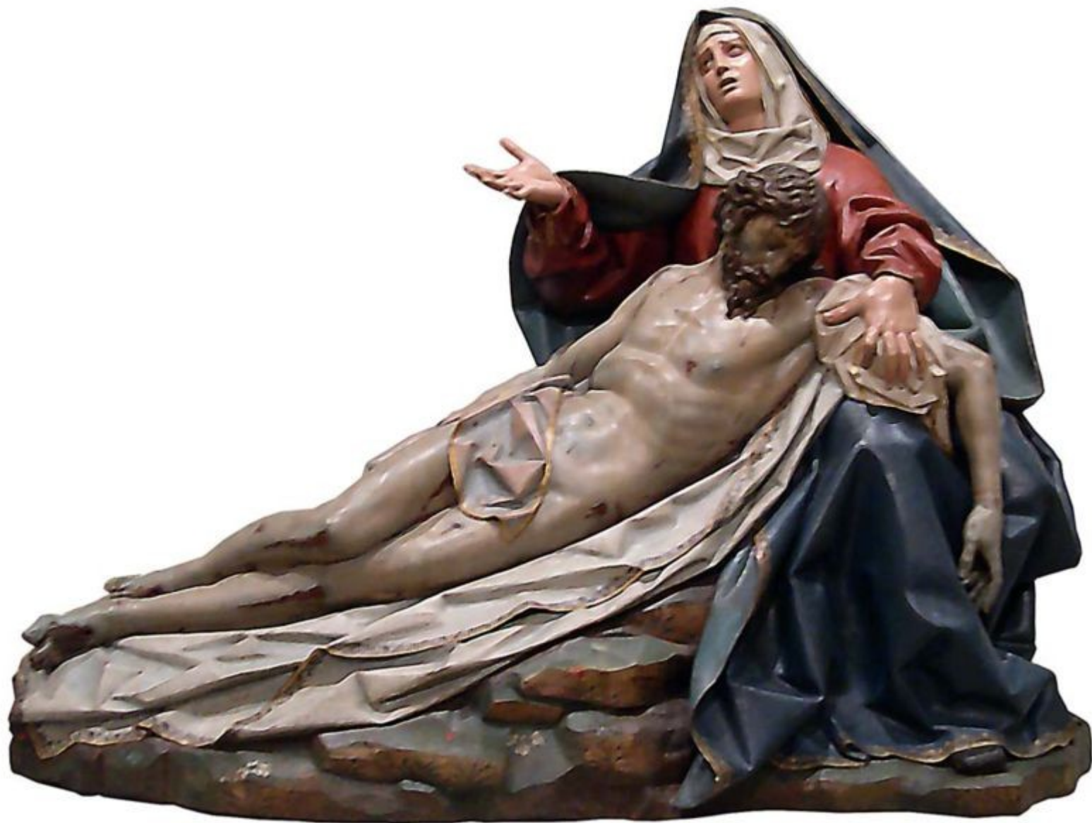
Gregorio Fernández, Pietat