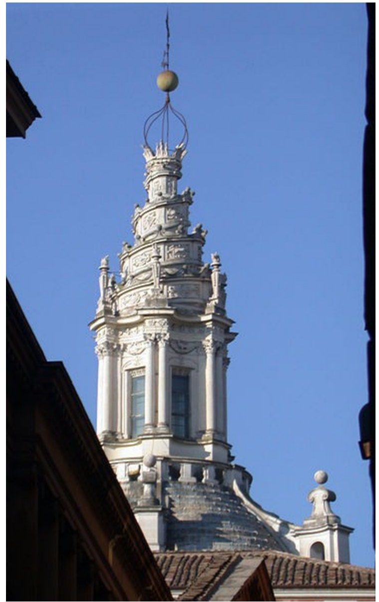
Borromini, Sant Ivo alla Sapienza, Roma Obra mestra del barroc. La caracteritza la cúpula ondulada i la llanterna en espiral.