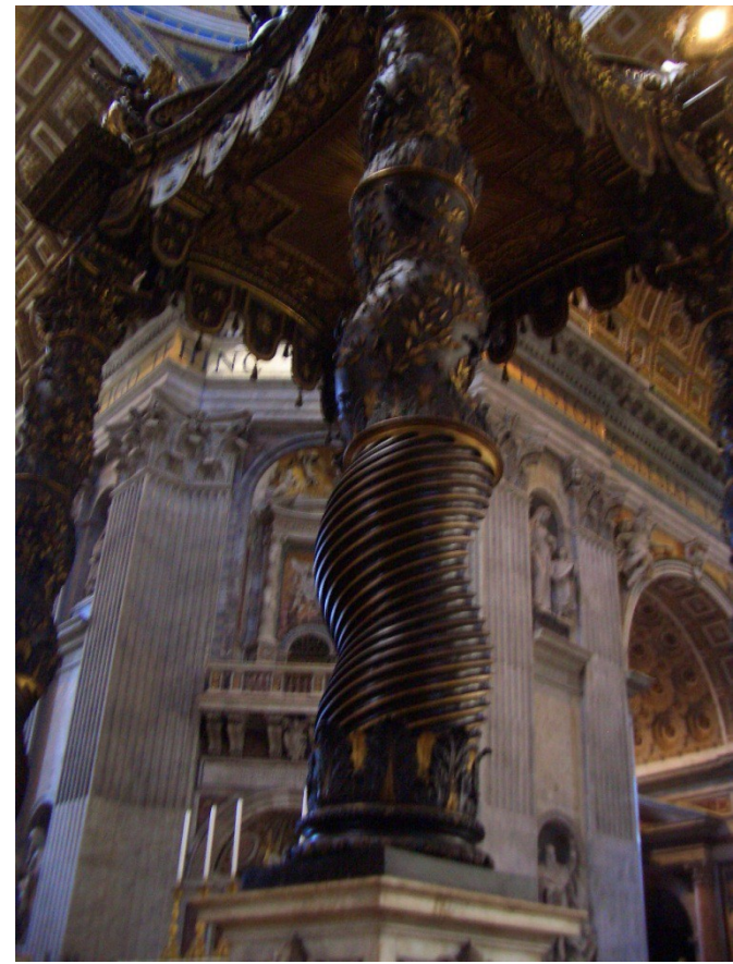
Baldaqú de San Pere, de Bernini, sostingut per 4 columnes salomòniques