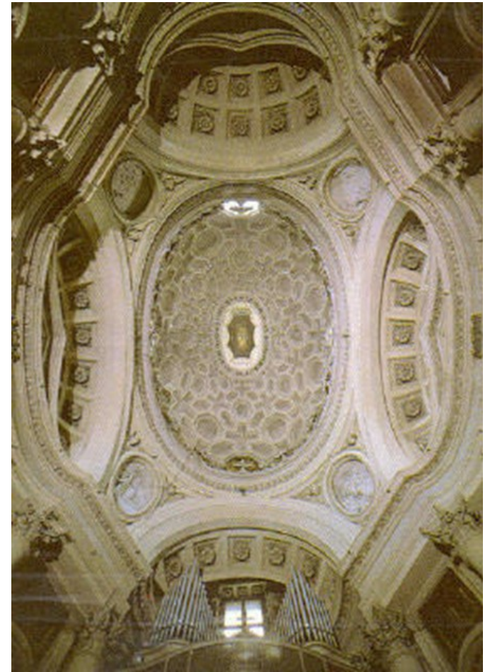
Borromini, cúpula ovalada de Sant Carlo alle Quattro Fontane