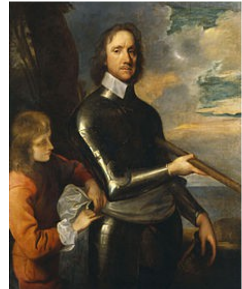
Robert Walker, Cromwell. 1640