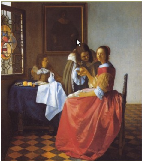
Vermeer, La jove del vas

Al segle XVIII començaren a regnar a Espanya els Borbó produint grans canvis polítics i l'apropament amb França. També és el segle de la Il·lustració , que posa les bases dels moviments revolucionaris posteriors.