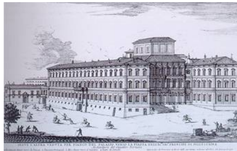
Gravat del palau Barberini, Roma