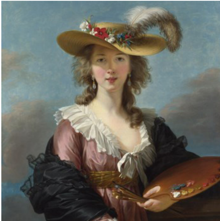
Autoretrat , d'Élisabeth Vigée Le Brun, 1782 (Londres, Galeria Nacional)