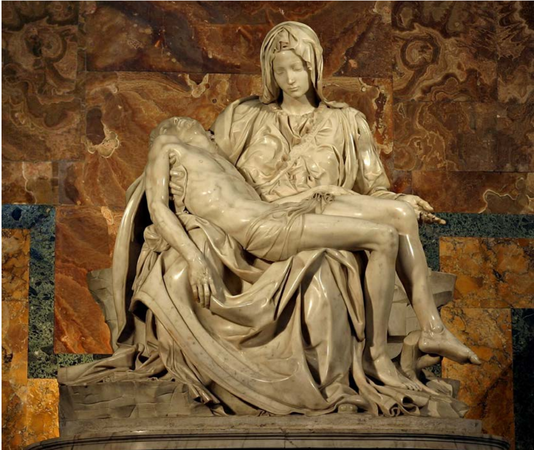
Pietat , de Miquel Àngel

a) Dateu l'obra i situeu-la en el context històric i cultural corresponent.