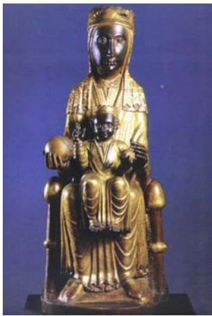
Maredeu de Montserrat (ca. 1200, Montserrat, Basílica)

e) Enumereu quatre diferències o semblances entre les dues escultures següents, representatives del romànic i del gòtic, respectivament.