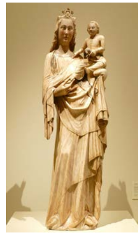
Maredeu de Sallent de Sanaija (ca. 1350, Barcelona, MNAC)