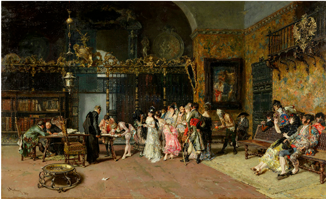
La vicaria , de Marià Fortuny