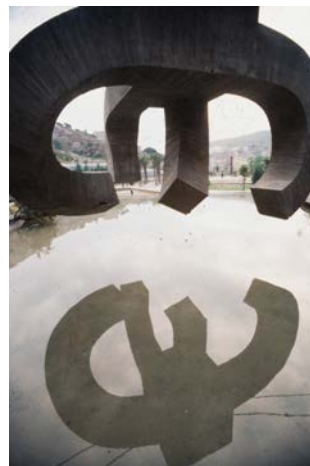
Elogi de l'aigua , d'Eduardo Chillida