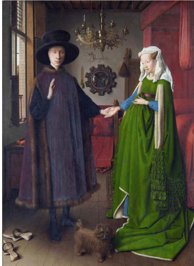
El matrimoni Arnolfini , de Jan van Eyck

a) Dateu l'obra i situeu-la en el context històric i cultural corresponent.