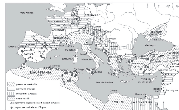
Figura 1. L'imperi d'August

Font: Kinder, Hilgemann (1971). Atlas histórico mundial . (vol. 1, pàg. 96).