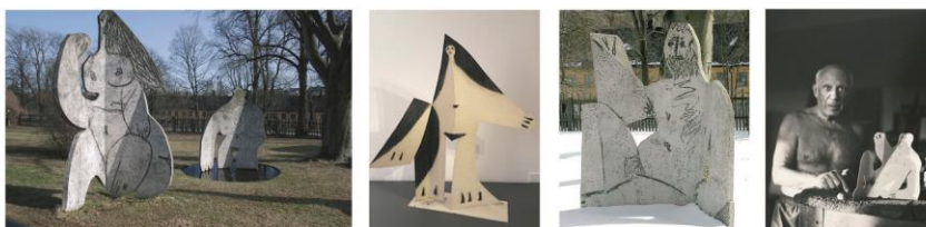
Escultures de Pablo Picasso