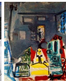
Las meninas de Velázquez i reinterpretades per Picasso (1957)