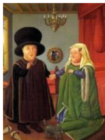
"El Matrimonio Arnolfini" de Van Eyck i Fernando Botero.