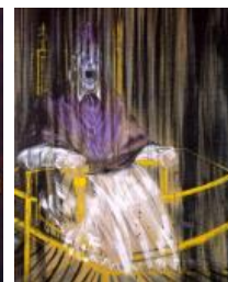
"Inocencio X" de Velázquez i Francis Bacon