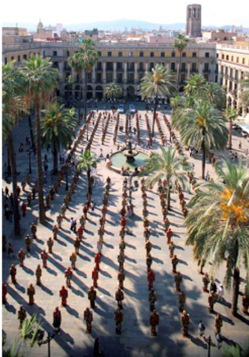
Trashpeople de HA Schult, organizado por Drap Art, Plaça Reial, 2007

Durante el periodo de convocatoria DRAP ART 07 ha recibido 240 proyectos, de los cuales se han elegido 30 artistas para la exposición colectiva, 50 para el mercado de arte y diseño, 4 espectáculos, 6 talleres y 3 artistas para realizar intervenciones en el espacio público.