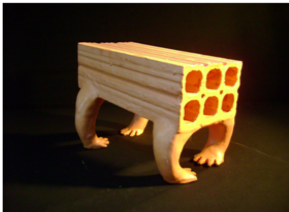
Perrito Ladrillo, Por Xpan

Barcelona y de Israel, y en Barcelona en 1999 con artistas franceses, griegos, montenegrinos, brasileños y barceloneses.