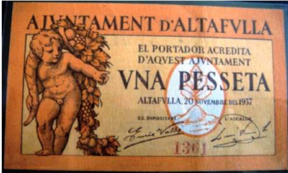
FONT: Ajuntament d'Altafulla (Tarragonès), novembre de 1937.