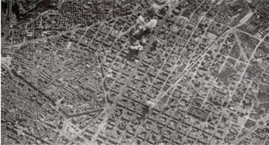
Bombardejos sobre Barcelona

FONT: Aviazione Legionaria Italiana, 18 de març de 1938.