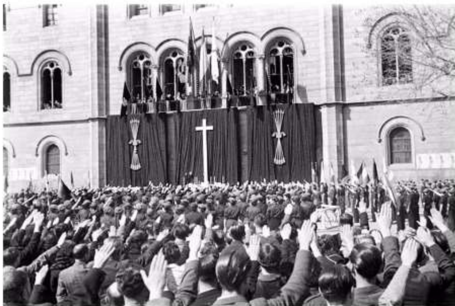
Missa de campanya a la plaça Universitat de Barcelona FONT: Josep Branguli, 7 de març de 1939 (Arxiu Nacional de Catalunya).

Cal que l'alumnat expliqui el fracàs de l'alçament militar a Catalunya, els combats a Barcelona iniciats el 19 de juliol i la derrota dels alçats; la creació del Comitè de Milícies Antifeixistes i la repressió; les patrulles de control; la destrucció de patrimoni religiós; la sortida de columnes cap als fronts [1,25 punts]; les col·lectivititzacions; la dualitat de poders, les tensions entre el govern de la Generalitat i la CNT i el POUM i els Fets de Maig de 1937, explicant què foren, incloent-hi la intervenció del govern central, i llurs conseqüències, entre les quals cal citar la repressió de la CNT i del POUM, la fi de l'hegemonia anarcosindicalista i l'increment del poder del PSUC, entre d'altres. [1,25 punts]