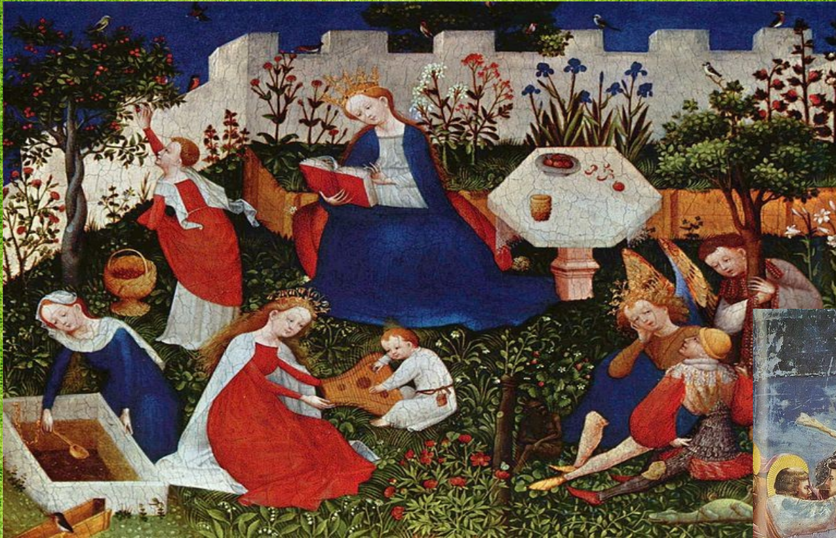
Maestro del Jardín del Paraíso (1410).