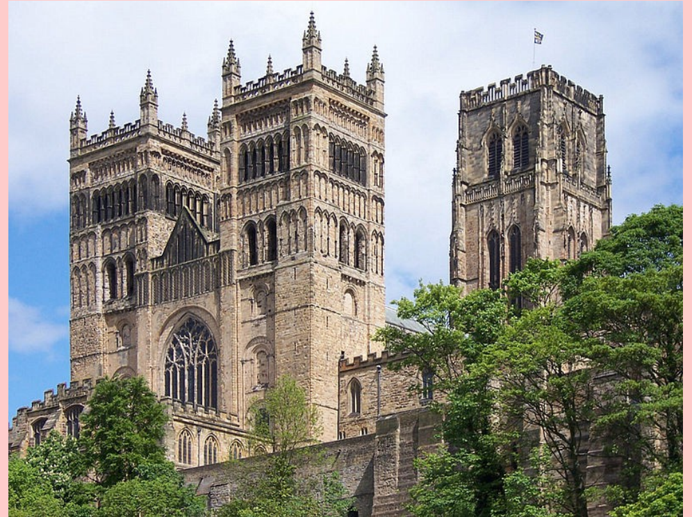
Catedral de Durham, Regne Unit (1093).