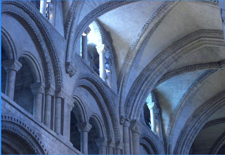
Voltes de creueria a l'interior de la Catedral de Durham.