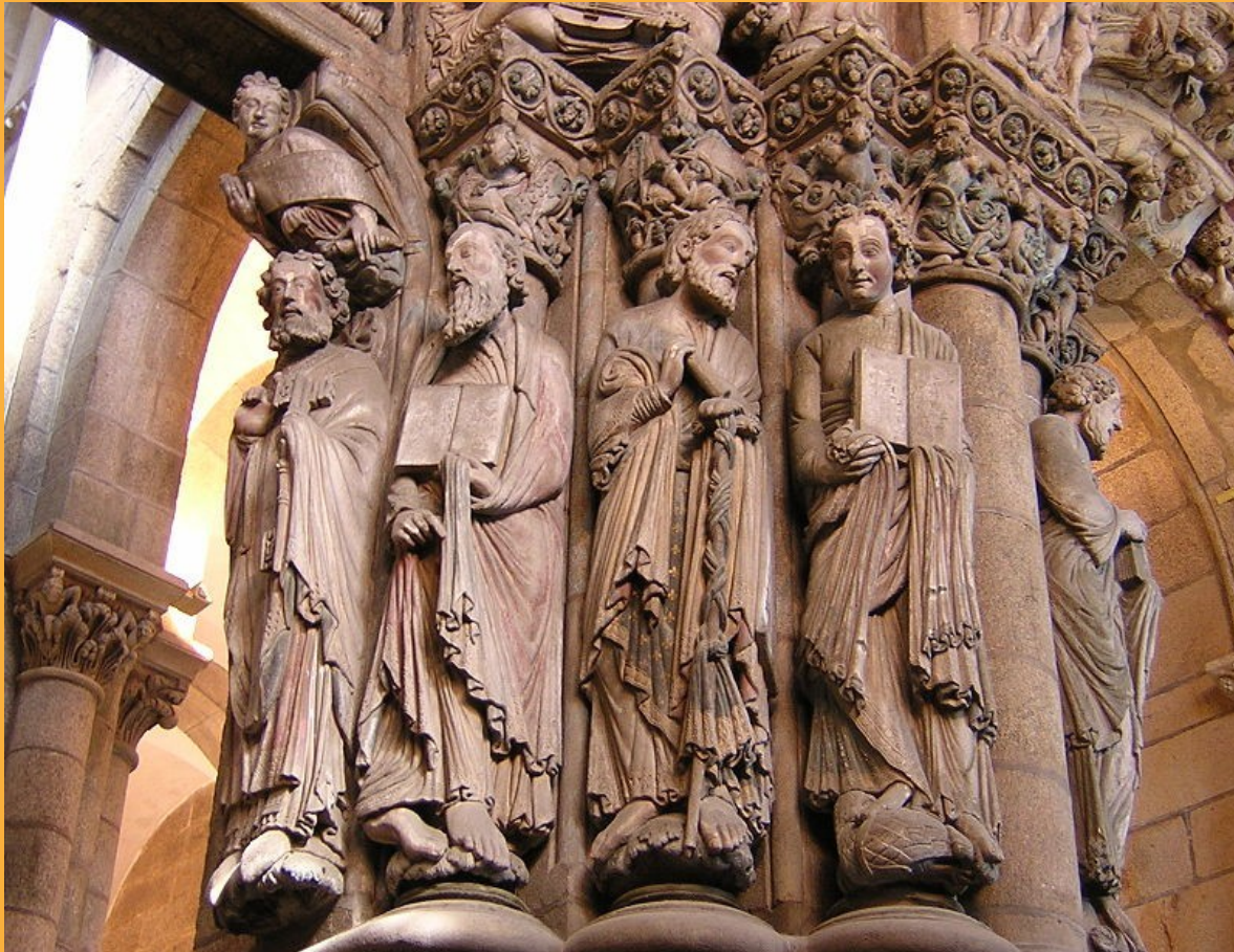
Apòstols de la catedral de Santiago de Compostel.la (1075).