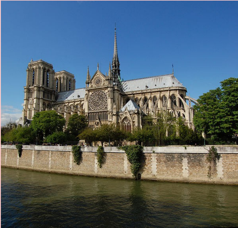
Catedral de Notre Dame, París (1345).