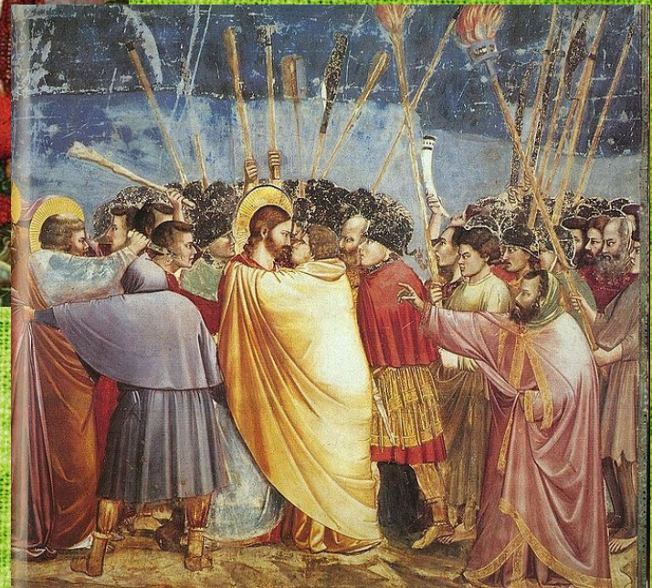
El beso de Judas (1306).