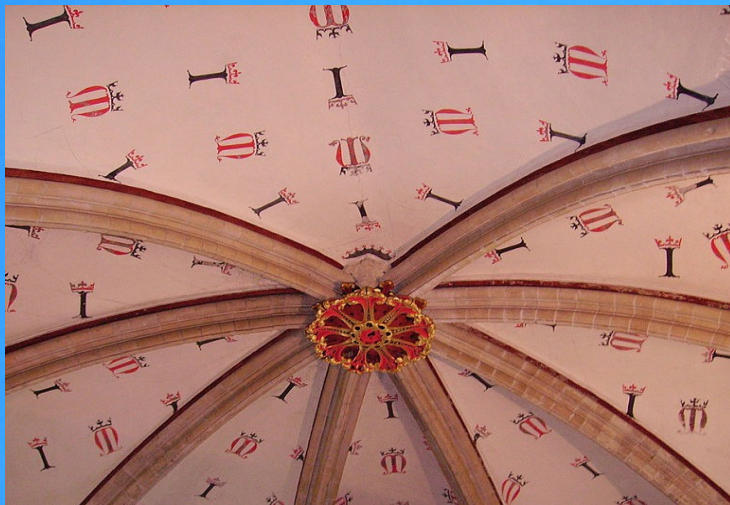
Policromats de la Catedral de Canterbury.