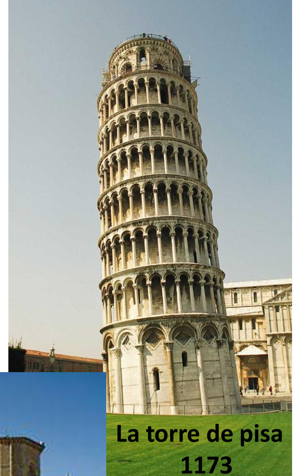
La torre de pisa 1173