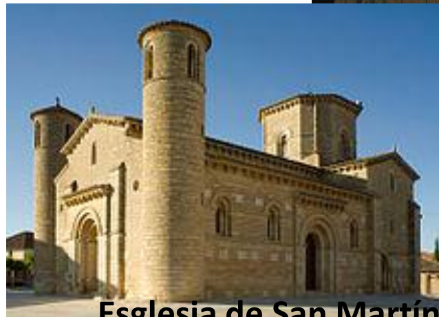
Esglesia de San Martín de Frómista 1118