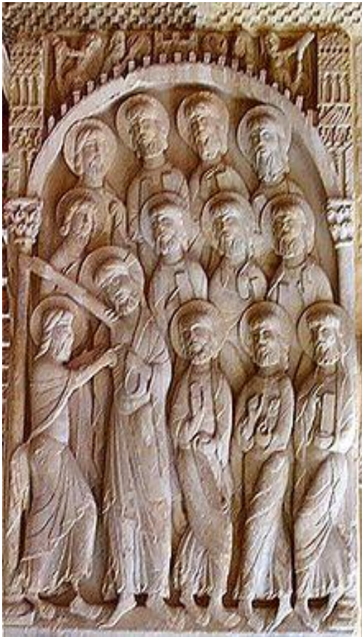
Relleu del Monestir de Silos 954