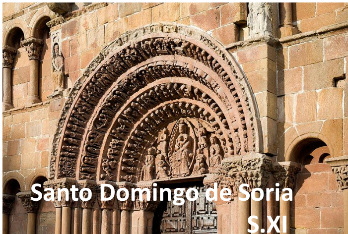
Santo Domingo de Soria S.XI