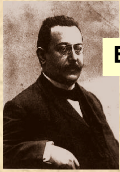
Enric Prat de la Riba