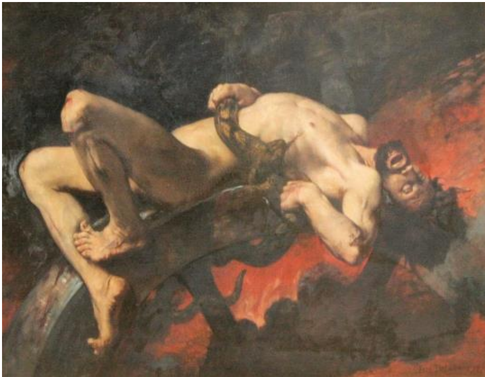
Ixió a la roda de foc

Zeus pensava que beure el nèctar dels déus havia trastocat Ixió i es va conformar amb desterrar-lo. Però com que presumia d'haver seduït Hera va decidir matar-lo amb un raig i el va condemnar al Tàrtar, on Hermes el va lligar amb serps a una roda amb foc que donava voltes sense parar. Només va parar el dia que Orfeu va estar als inferns, ja que el seu meravellós cant va fer que la roda parés.