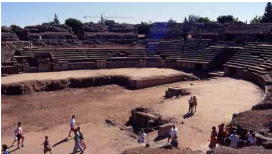
Amfiteatre, Mérida (S.G.).

Inaugurat l'any 8 a.C., l' amfiteatre és de dimensions considerables, encara que està construït amb materials pobres (granit, maó i formigó). Medeix un poc més de 126 m x 102 m i la sorra 54'50 x 41'15 m. La seva estructura és l'habitual, amb una cauea o apta per a 15.000 espectadors i unes fossae en forma de creu.