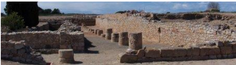
Restes del criptopòrtic que envoltava el temple del fòrum (S.G.).

probablement dedicats al culte imperial . Finalment tot el recinte es va tancar amb tres portes.