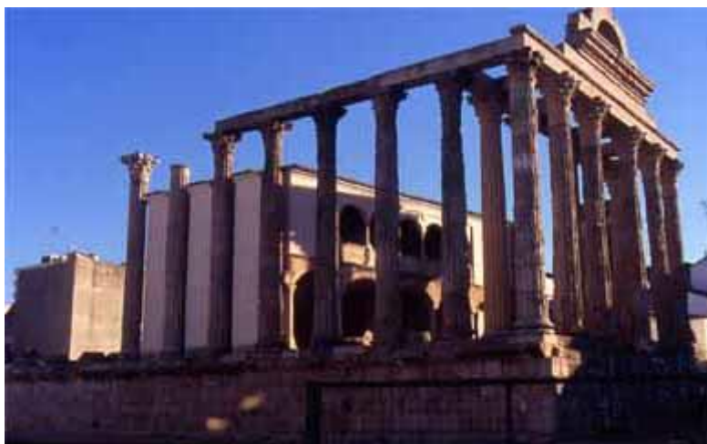
El fòrum municipal d'Emèrita: pòrtic (dalt) i (esquerra) temple erròniament anomenat de Diana, en realitat de culte imperial, Mérida (S.G.).

El teatre i l'amfiteatre formen un conjunt construït segons un únic projecte i sobre el mateix turó, sobre el qual recolzen les seves respectives graderies. El teatre és l'edifici més ben conservat i més grandios de Mérida. Va ser inaugurat el 16-15 a. C. i reformat en diverses ocasions. La seva cauea graderia tenia capacitat per a 6.000 espectadors. El més destacable de l'edifici és el frons scaenae , compost de dos pisos decorats amb columnes de marbre i una sèrie d'escultures de déus i retrats imperials. Rere el frons scaenae hi havia un peristil o pòrtic enjardinat.