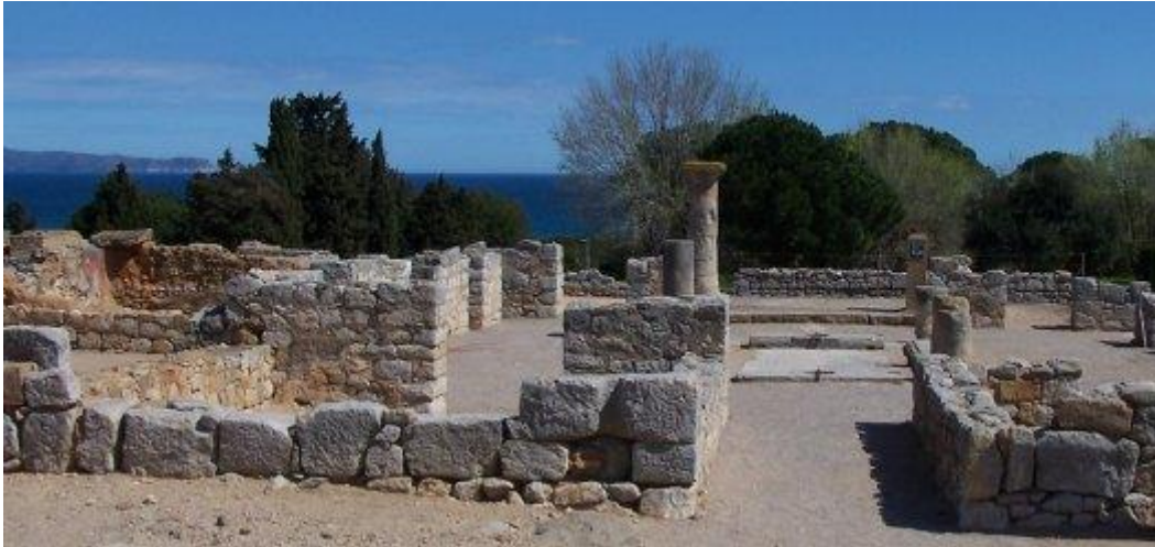
Entrada i atri de la domus 1 (S.G.).

A partir del segle I d.C. Empúries pateix una lenta decadència, com ja evidencia la humilitat dels nous edificis públics com l'amfiteatre i la palestra. Diversos factors poden explicar el aquest procés: la progressiva inutilització del port pels sediments aportats pel Fluvià, els canvis dels fluxos comercials en les rutes marítimes, la importància creixent de ciutats com Tàrraco o Bàrcino i les reformes administratives de Vespasià . Tant la ciutat romana com la Neàpolis es van anar despoblant i finalment la ciutat es va replegar altre cop en el petit promontori de l'actual Sant Martí d'Empúries, la primitiva Paleàpolis , que va ser seu episcopal en l'atiguitat tardana i època visigòtica. El nom es mantindria encara amb el comtat medieval d'Empúries i amb la comarca de l'Empordà.