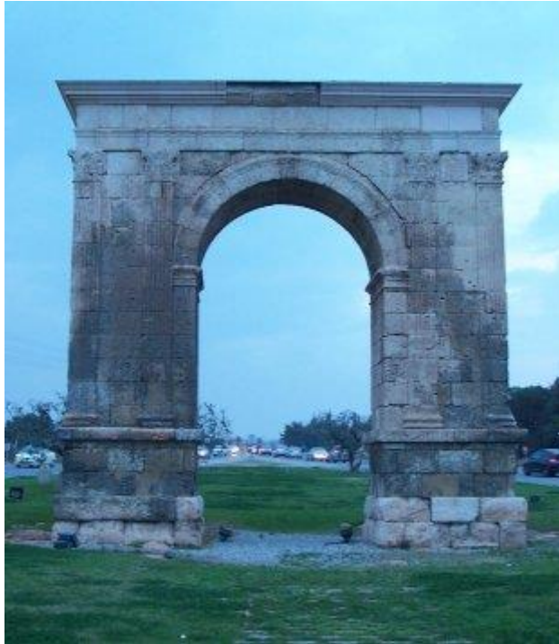
Arc de Berà, finals del segle I a. C, construït per Luci Licini Sura sobre la Via Augusta.

Els romans van arribar al que ara és Tarragona a l'inici de la segona guerra púnica (218 a.C.), quan Gneu Corneli Escipió, per afermar la nova dominació romana des d'Empúries fins al riu Ebre, va atacar un campament cartaginès situat a la vora d'un poblat ibèric anomenat Kese, a la part baixa de l'actual Tarragona, prop de mar. Poc després Tàrraco va esdevenir la principal base d'hivernada dels exèrcits romans d'Hispania, comandats pels germans Escipió, i, morts aquests, per Publi Corneli Escipió el jove. Per això Plini va qualificar la ciutat de Scipionum opus , obra dels Escipions ( Història natural , III, 4, 21). El campament militar es va situar dalt del turó que dominaria la futura àrea de la ciutat i s'envoltaria d'una sòlida muralla .