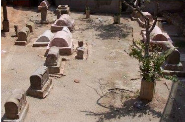
Necròpolis de la plaça de la Vila de Madrid (S.G.).

Com era habitual en les ciutats romanes les vies properes que hi accedien estaven flanquejades per àrees d'enterrament com encara és possible veure a la necròpolis de la plaça de la Vila de Madrid, que conserva 85 elements funeraris, sobretot del s. II d.C. al III, que abracen els tipus més freqüents de sepultura romana de categoria humil: cupae , ares, esteles, cobertures de tegulae o d'àmfora o fosses.