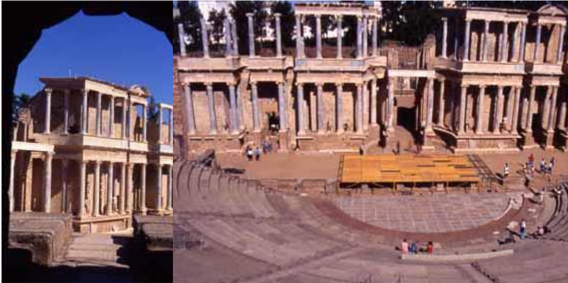
Teatre de Mérida (S.G.): el frons scaenae des d'un uomitorium i des de la cauea.

Inaugurat l'any 8 a.C., l' amfiteatre és de dimensions considerables, encara que està construït amb materials pobres (granit, maó i formigó). Medeix un poc més de 126 m x 102 m i la sorra 54'50 x 41'15 m. La seva estructura és l'habitual, amb una cauea o apta per a 15.000 espectadors i unes fossae en forma de creu.