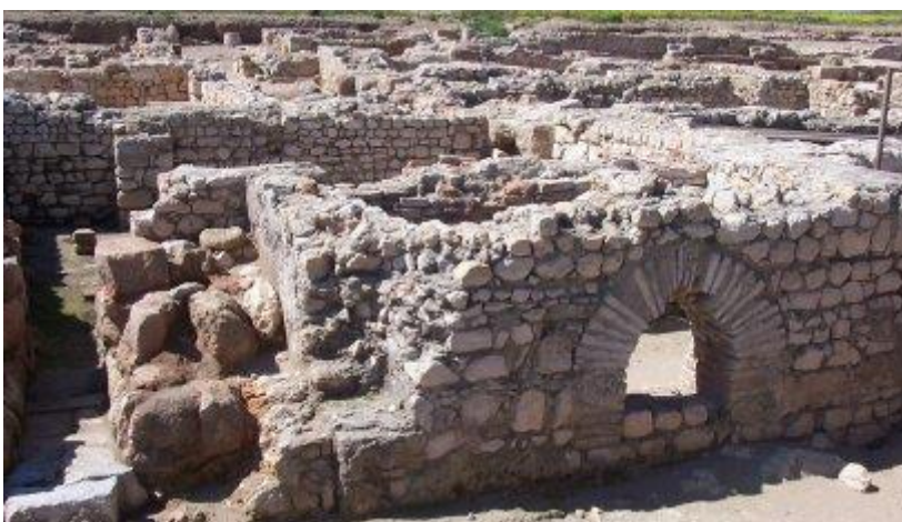
El forn ( prae-furnium ) de les termes.

Al nord del fòrum es troben un mercat i les termes públiques, descobertes l'any 2000 i recentment excavades. Els altres edificis públics coneguts són l'amfiteatre i la palestra, tots dos bastits, el segle I d.C., extramurs però ben a prop de la muralla, a una banda i l'altra de la porta sud. L' amfiteatre emporità era un edifici molt modest en forma d'un òval de 93 x 44 m. En resta la base del podium i dels murs radials que sustentaven les grades, probablement de fusta. La palestra , edifici destinat a practicar activitats físiques, només està testimoniada pel rectangle arrasat del seu pòrtic, que envoltava l' arena .