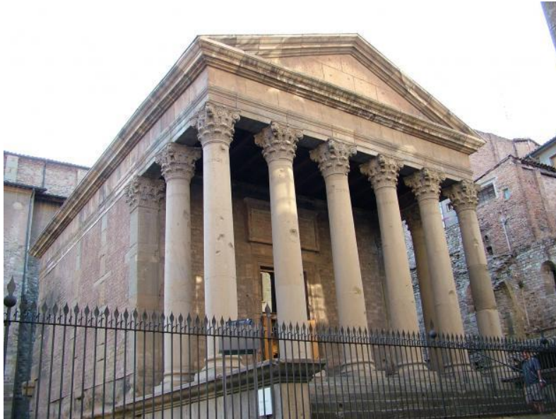
Temple romà de Vic.