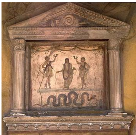
Lararium de la casa dels Vetti, Pompeia