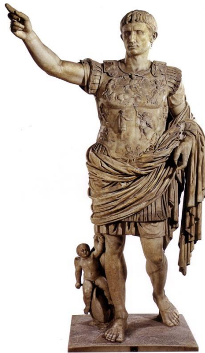
August de Prima Porta