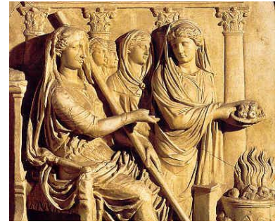
Vestals alimentant el foc sagrat