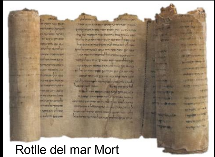
Rotlle del mar Mort

A la cultura hebrea el llibre és sagrat en tant que dipositari de la paraula de déu.