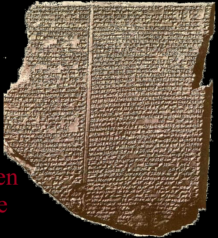
Pròleg del poema èpic de Gilgamesh en tauleta cuneïforme

Entre els assiris i els babilonis, els escribes eren una casta aristocràtica que pretenia veure en la disposició dels estels "l'escriptura del cel".