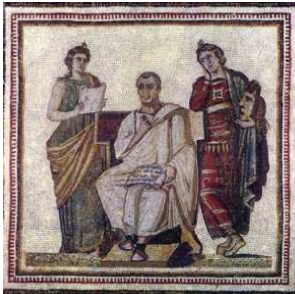
Virgili entre les muses Clio i Melpòmene

convertir en art la quotidianitat. Finalment, les Epístoles , entre les quals destaca l'Epístola als Pisons o Art poètica, per ser, amb la d'Aristòtil, la poètica més llegida i més influent en la història del pensament literari occidental. Va gaudir del favor de l'alta societat romana, per la qual cosa va considerar poeta oficial i dinàstic d'August, que li va encarregar un himne oficial, el Carme seculare en honor a Apol·lo i Diana.