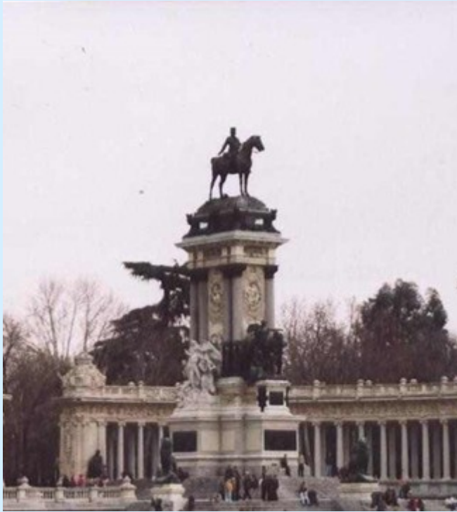
Monument a Alfons XII