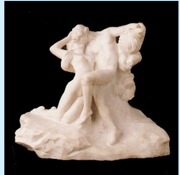
Rodin: Eterna Primavera .