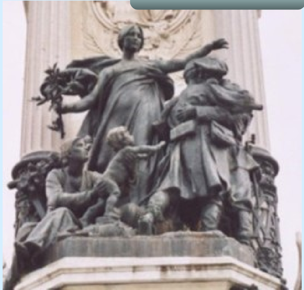
Grup: La pau