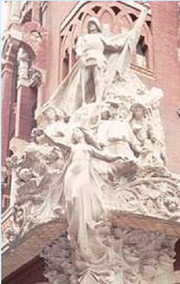
La cançó catalana