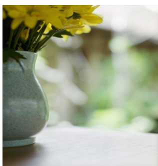
Jarrones: Perfectos para todo tipo de flores.