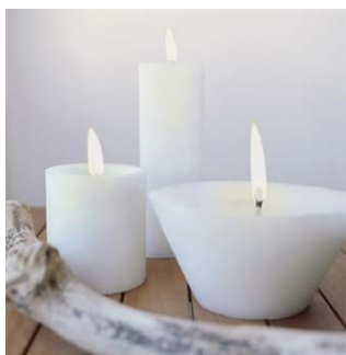
Velas: Quedan bien en cualquier lugar.