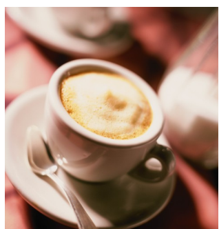
Juegos de tazas: Darse un premio, es bueno.