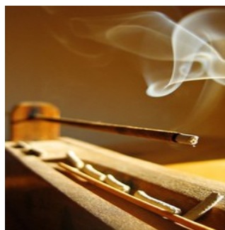
Incienso: Elige tu aroma o olor preferida