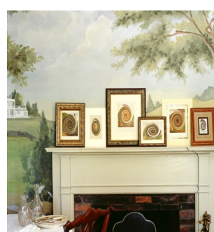
Marcos y cuadros: Para ver los mejores momentos.