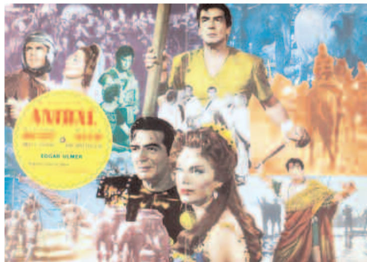
Aníbal Directores: Carlo L. Bragaglia Edgar Ulmer Italia, 1959