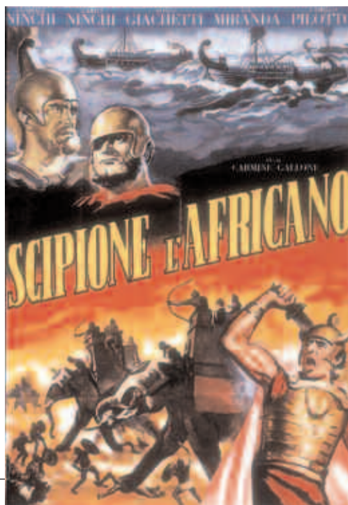
Escipión, el Africano Director: Luigi Magni Italia, 1971