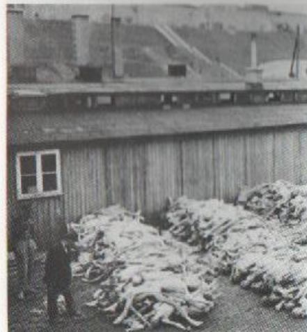
Detalles del campo de enfermos tras la liberación (mayo de 1945)