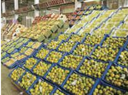
El comerç interior