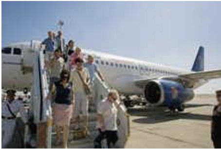
El transport aeri