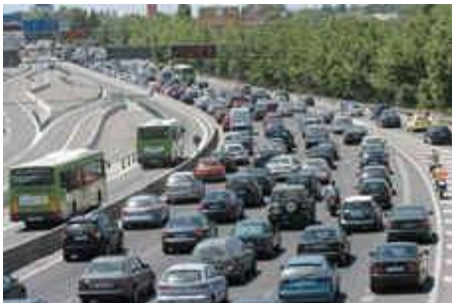
El transport per carretera