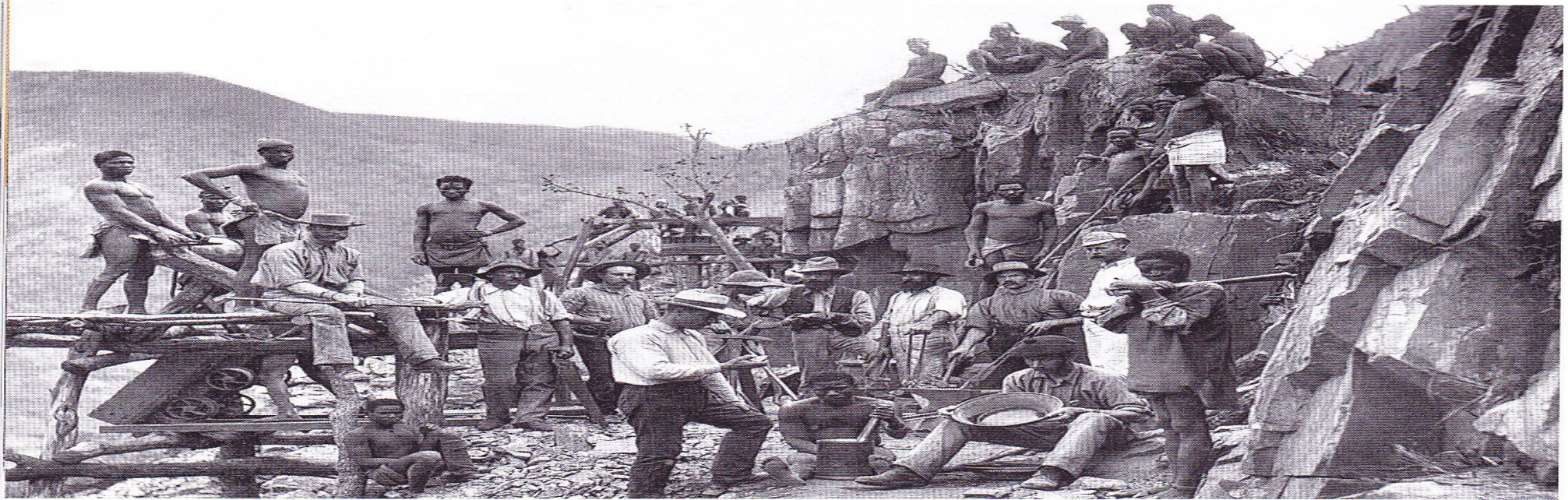
■ Mina d'or a Ciutat del Cap. Els recursos naturals del continent africà van desvetllar l'interès dels europeus.