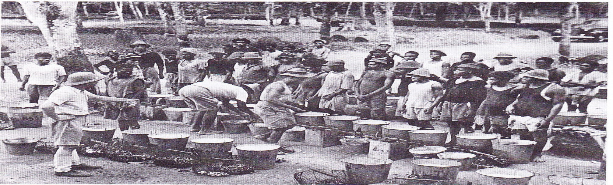
■ Àfrica equatorial francesa. Els pobladors europeus van sotmetre a treballs forçats la població autòctona.