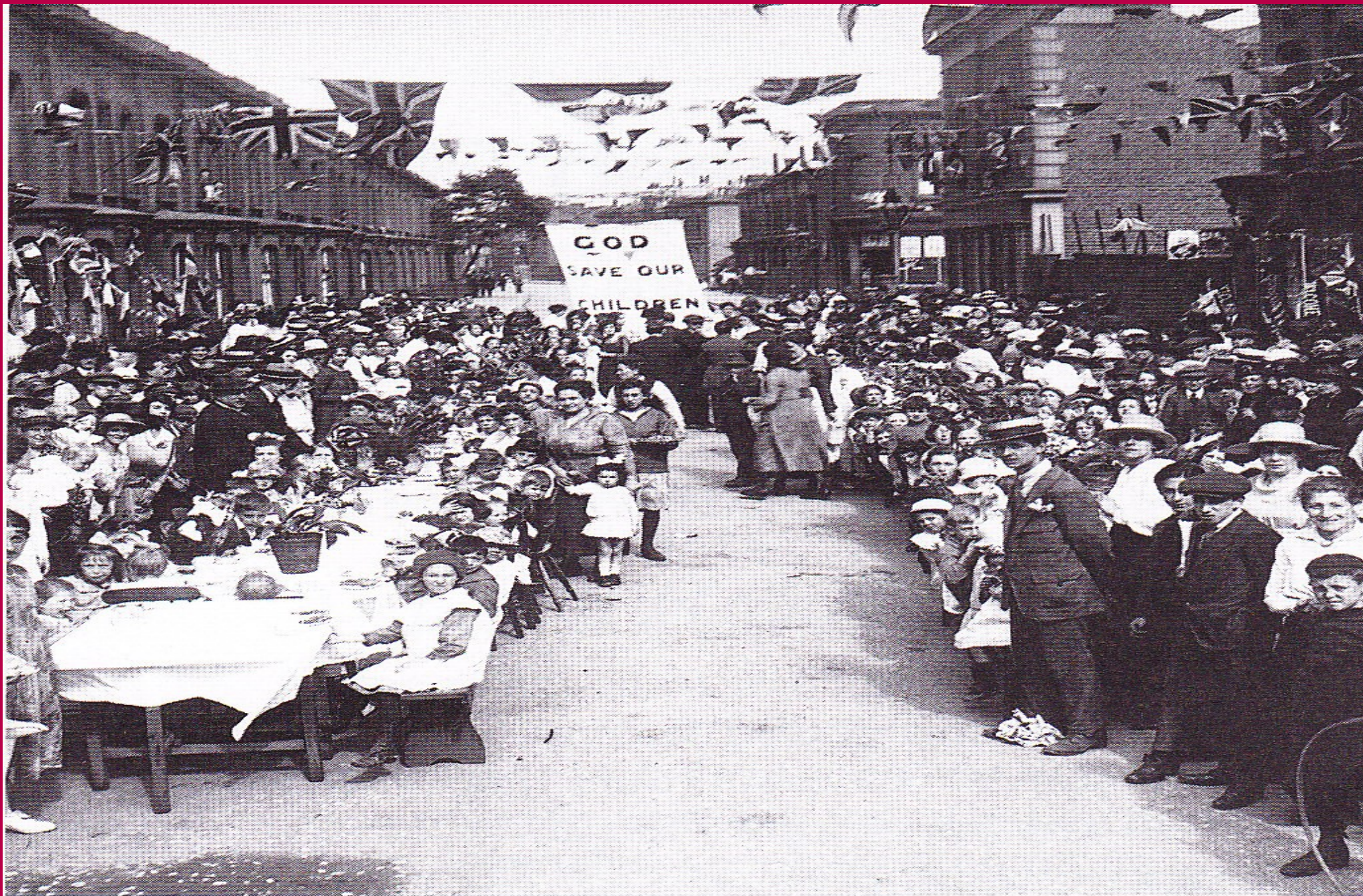
■ Celebració de la fi de la Primera Guerra Mundial als carrers d'una ciutat anglesa.