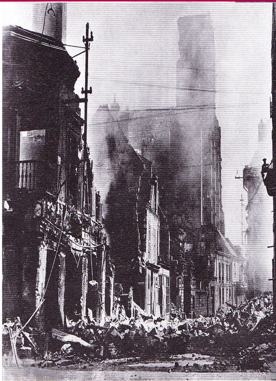
■ Soissons (França). Els països bel·ligerants, sobretot França i Bèlgica, van patir una devastació d'una gran intensitat.