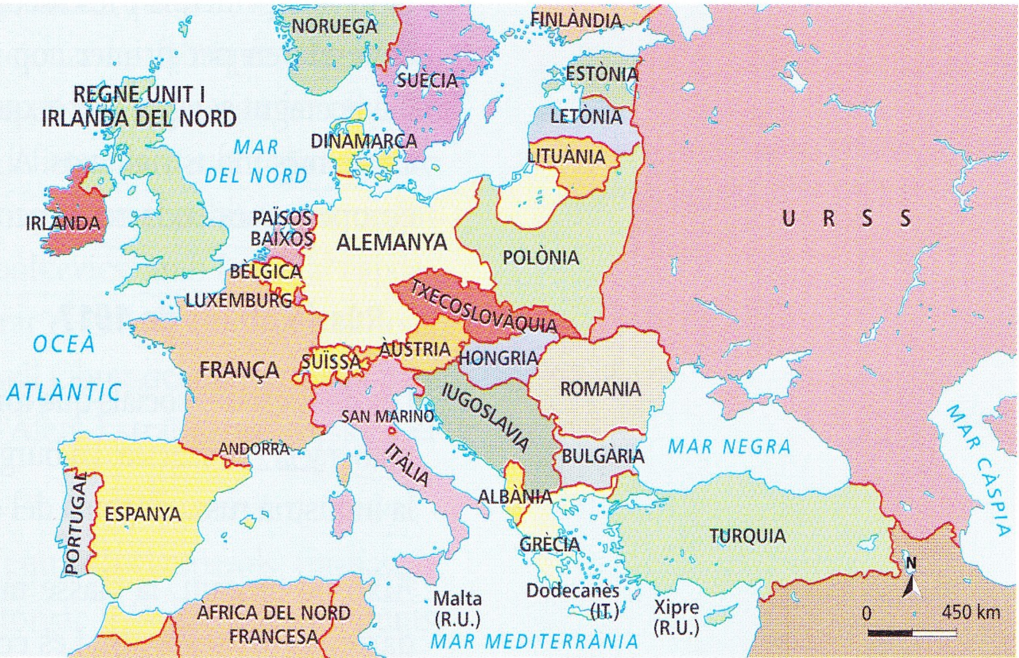
L'Europa sorgida del Tractat de Versalles.