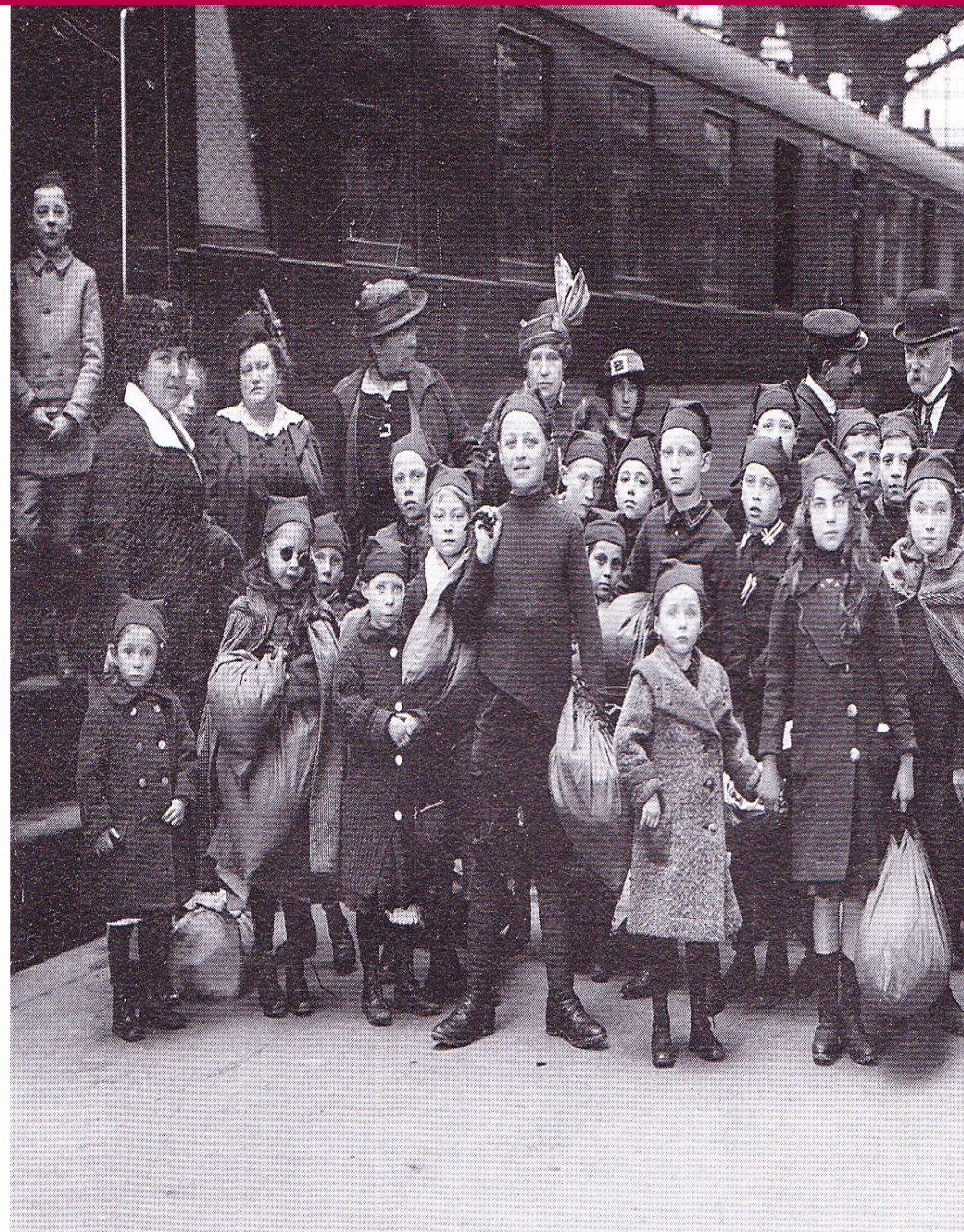
■ Evacuació d'orfes francesos. A les víctimes mortals en combat cal sumar-hi les famílies delmades, els orfes i les vídues.