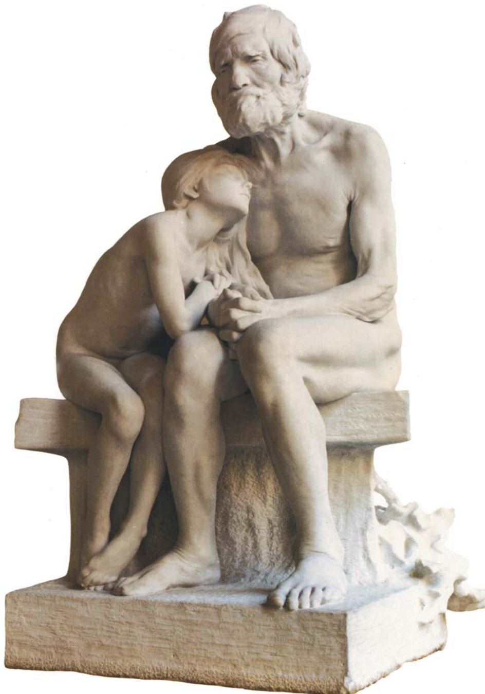
Els primers freds , de Miquel Blay.