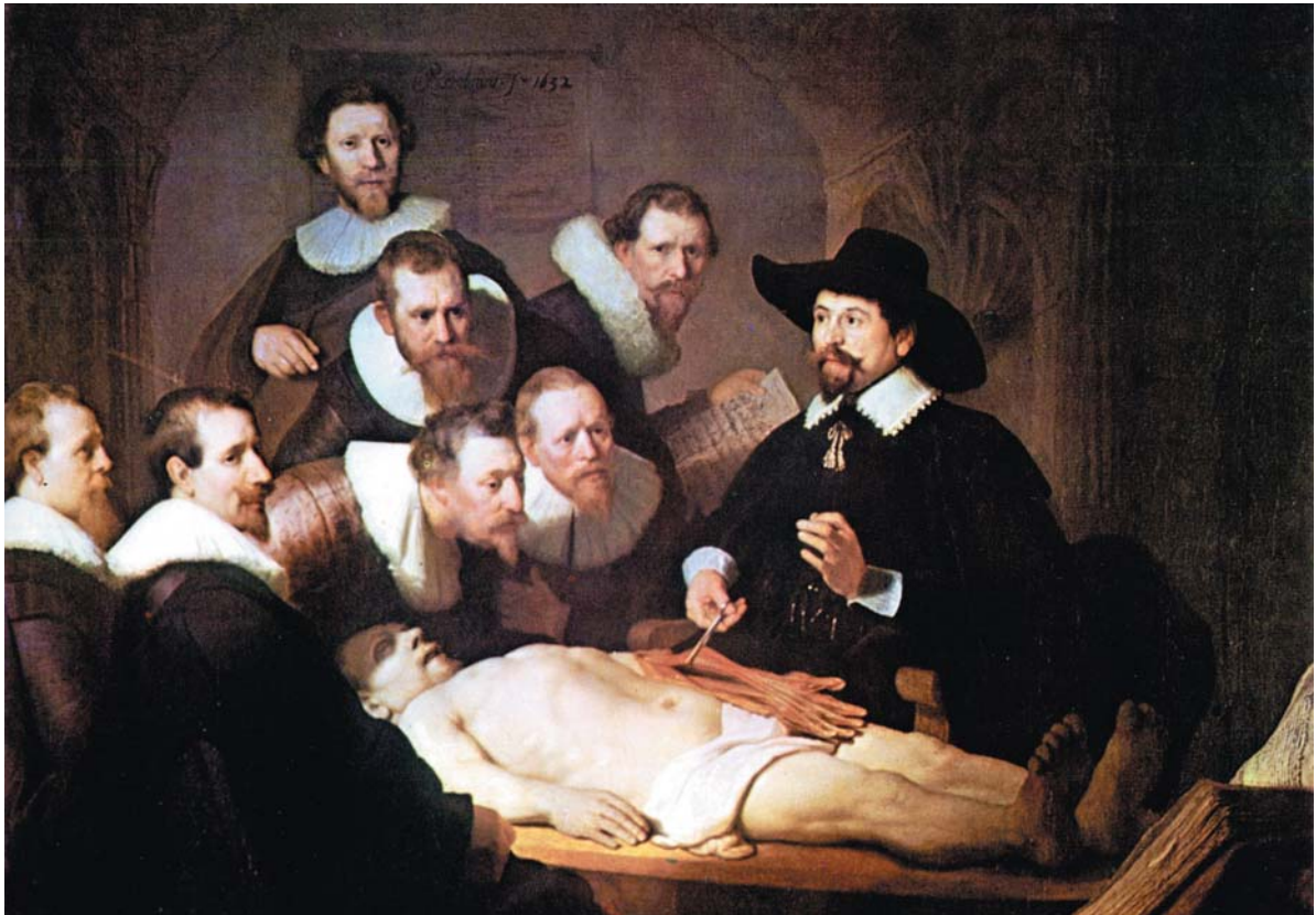
OBRA 3. La lliçó d'anatomia del doctor Tulp , de Rembrandt.