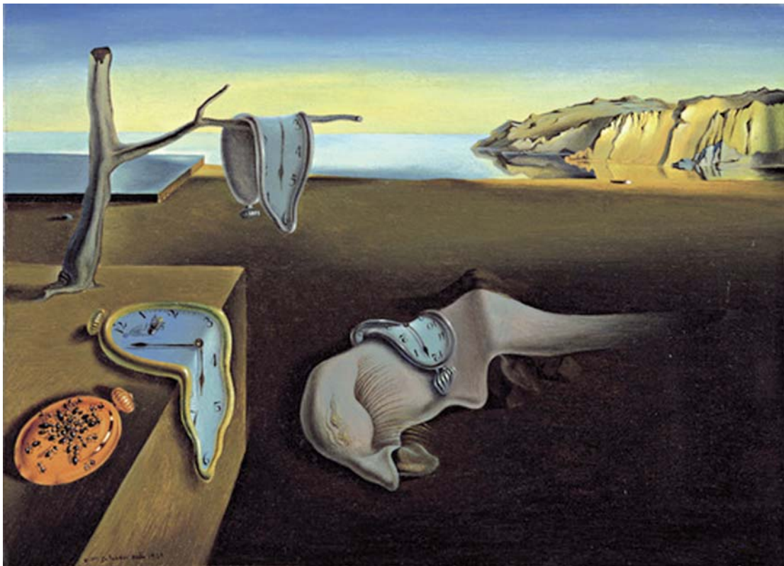
La persistència de la memòria , de Salvador Dalí.