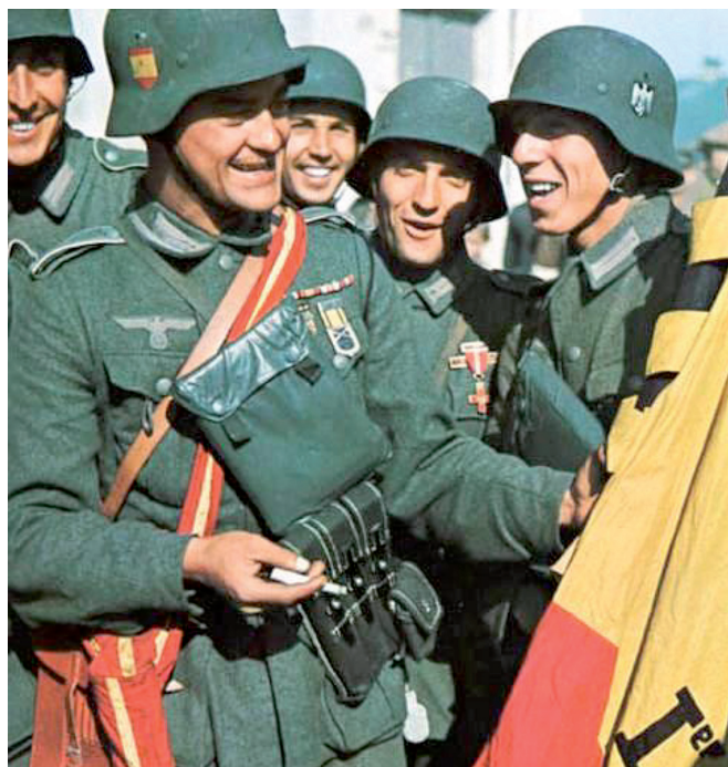
FONT: División Azul , 1941.